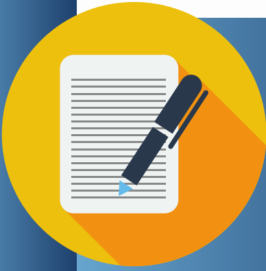
DIAGRAMA DOS PROCESSOS